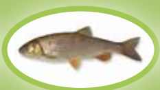
Kopvoorn - 30 cm