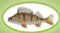
Baars - 22 cm