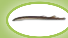
Rivierprik - 20 cm