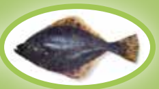
Bot - 20 cm