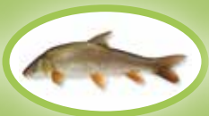
Barbeel - 30 cm