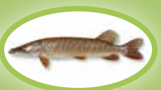
Snoek - 45 cm