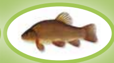
Zeelt - 25 cm

Vangt u een vis kleiner dan de minimummaat voor deze soort, dan moet u deze direct in hetzelfde water terugzetten!