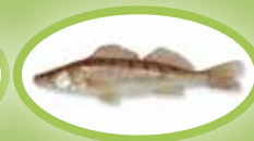
Snoekbaars - 42 cm