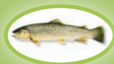
Beekforel - 25 cm